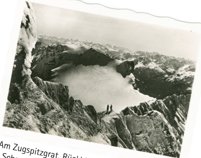
Am Zugspitzgrat, Rückblick auf Zugspitzplatt mit Schneefernerkopf; Oesterr. u. Schweizer Alpen