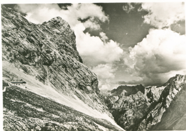
Knorrhütte (2052) gegen Dreitorspitze und Brunntalkopf