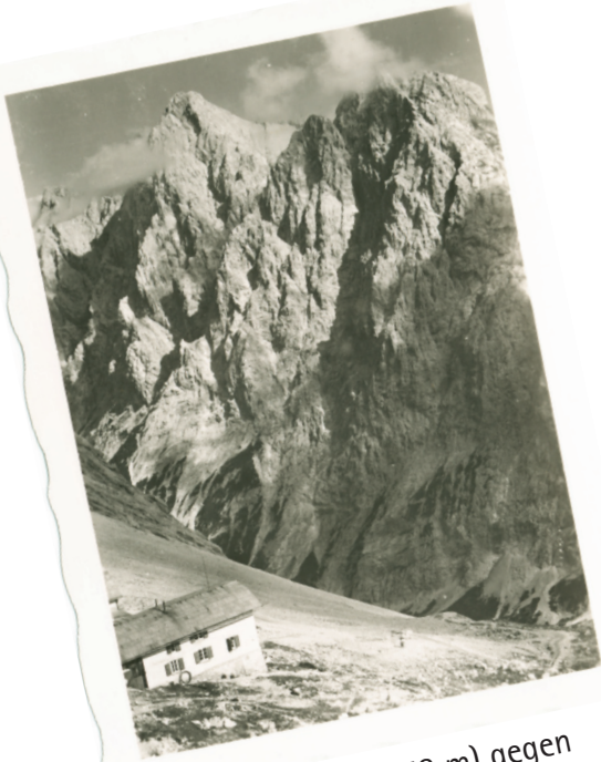
Knorrhütte (2052 m) gegen Hochwanner (2746 m)