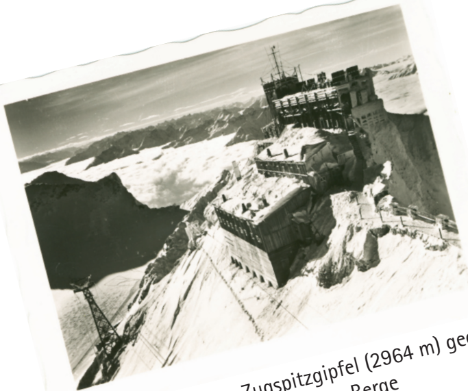
Münchner Haus am Zugspitzgipfel (2964 m) gegen österreich. u. Schweizer Berge