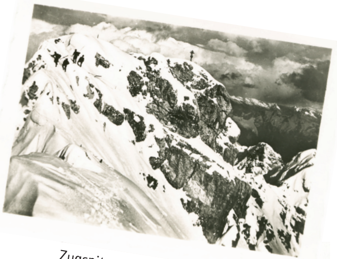
Zugspitz-Ostgipfel (2962 m)