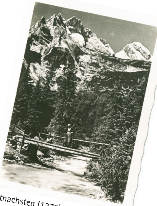
Partnachsteg (1370) gegen Gatterl- und Plattspitzen