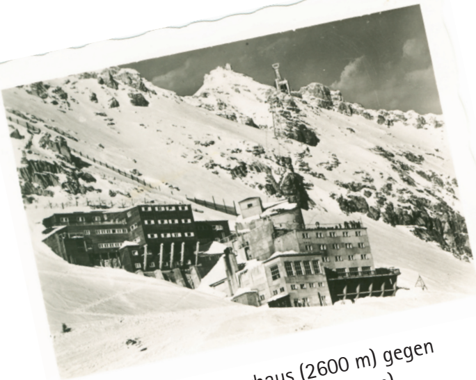
Schneefernerhaus (2600 m) gegen Zugspitzgipfel (2964 m)