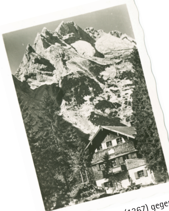
Reintalangerhütte (1367) gegen Gatterlspitzen