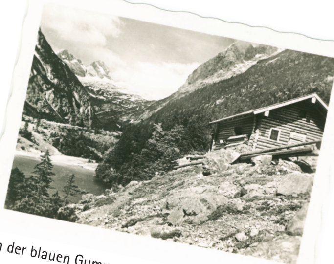
An der blauen Gumpe mit der Gumpenhütte (1211m)

Huber-Serie 6: Zugspitzbesteigung durchs Reintal