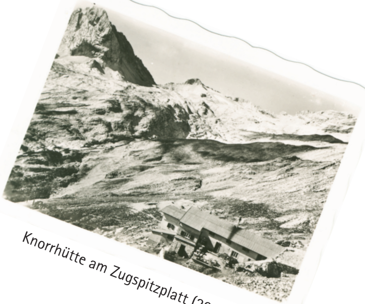
Knorrhütte am Zugspitzplatt (2052 m)